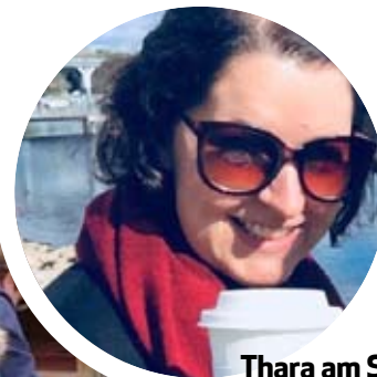
Thara am See

A: Im Juli bin ich mit dem Zug nach Ottawa, Québec City und Montréal gefahren, und im September bin ich zusammen mit unserer damaligen