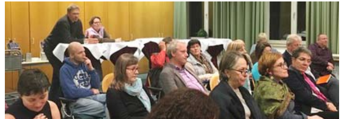
EKD Kirchenvorstand-Seminar in Deutschland, Feb. 2018