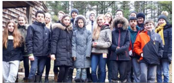
Konfirmanden- und Jugend-Freizeit im Februar mit der Agricola Luth. Kirche bei Crieff Hills