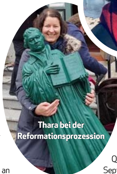
Thara bei der Reformationprozession

A: Ich erinnere mich an einen Sonntag: Ich war wirklich unzufrieden mit meiner Predigt; und dann kam nach dem Gottesdienst ein Mann zu mir und erzählte mir, dass er noch nie zuvor bei uns im Gottesdienst gewesen sei, aber dass er sehr dankbar dafür sei, dass unsere Türen offen gewesen seien, denn er habe gerade seine Mutter verloren und hätte einfach einen Platz gebraucht, an