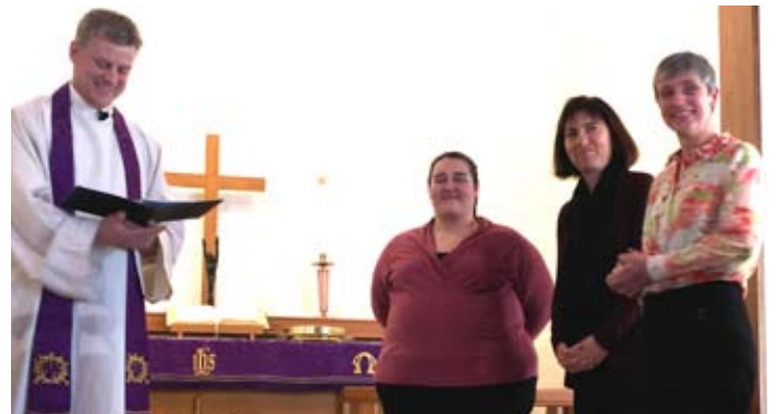
Einführung der Prädikantinnen