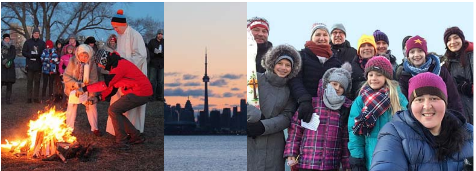
Osterfrühgottesdienst im Humber Bay Park West, 1. April 2018