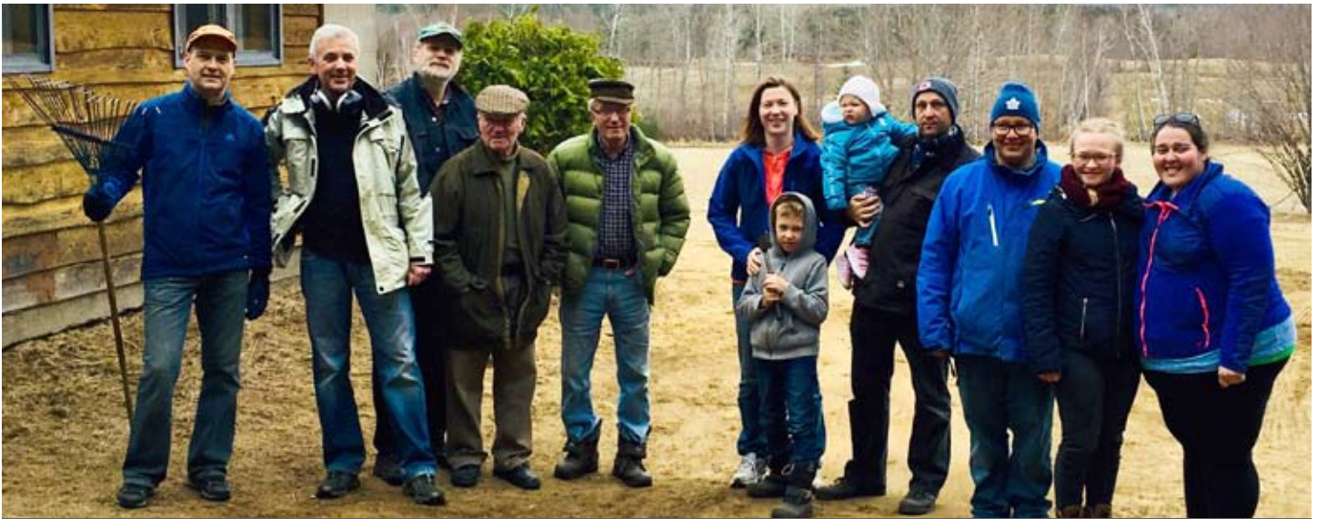
Das tapfere, tollkühne MLK Team nach dem erfolgten Frühlingsputz im Camp Lutherlyn, 28. April 2018 (Bericht folgt bald in den Webnachrichten)