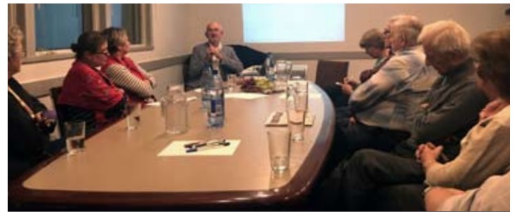
Pastor Vettters Vortrag und Diskussion zum Thema „Umgang mit Abschieden und Tod“