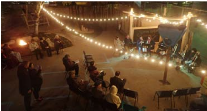
Konzert des Posaunenchores aus Berlin-Brandenburg – auf dem neuen Spielplatz im Kirchhof