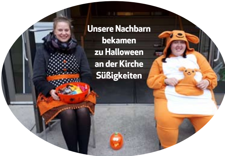
Unsere Nachbarn bekamen zu Halloween an der Kirche Süßigkeiten