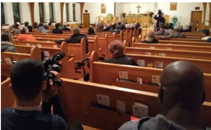
Transit Townhall im Oktober