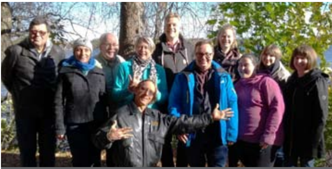
Die ehrenamtlichen Mitarbeiter von der MLK

Eine weitere Arbeitseinheit gab Gelegenheit Ziele im Rahmen der Neuerkenntnisse zu setzen. Ein Bericht der Tagung und die daraus gezogenen Ziele werden in der November-Gemeinderatsitzung bearbeitet. Als größte Herausforderung wurde die Bereitschaft zur Innovation mit neuen Gemeindegliedern identifiziert.