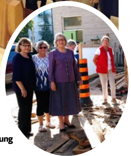
Käthe Kollwitz-AGO- Ausstellung und Besichtigung des neuen Spielplatzes