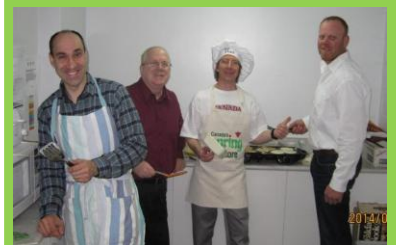
Die Küchenfeen beim Osterfrühstück