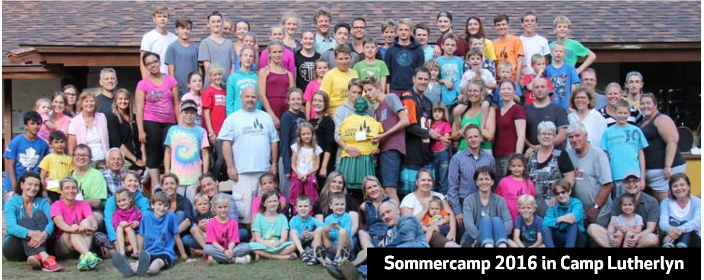
Sommerncamp 2016 in Camp Lutherlyn