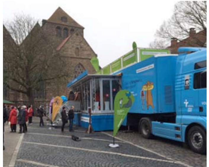
In Minden steht der Truck in schöner Kulisse auf dem Martini-Kirchhof

Sibiu und Dublin, aus Rom und Turku, aus Zürich, Villach und Schmalkalden, aus Worms, Augsburg und Osnabrück und von all den anderen Stationen in die Lutherstadt Wittenberg. „Geschichten auf Reisen“ findet aber nicht nur auf den 67 Stationen zwischen 3. November 2016 und 20. Mai 2017 im Geschichtenmobil statt, sondern ist online jederzeit abrufbar. Begleiten Sie den Truck auf seiner Tour und erleben Sie (nach), was an Geschichten auf diesem Weg zusammen gekommen ist.