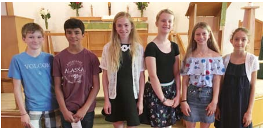
Die Konfirmanden des Jahrgangs 2017–2018