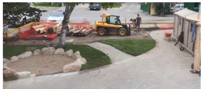
Der Spielplatz im Umbau