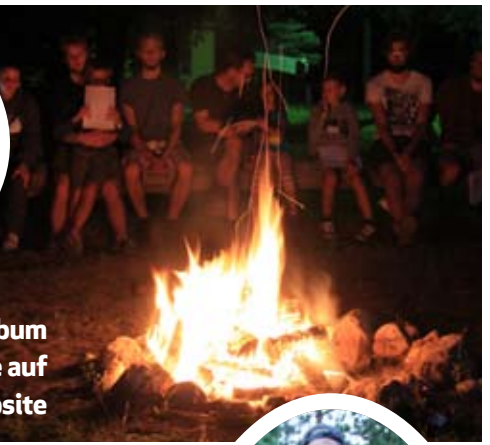
Ein Fotoalbum finden sie auf der Website