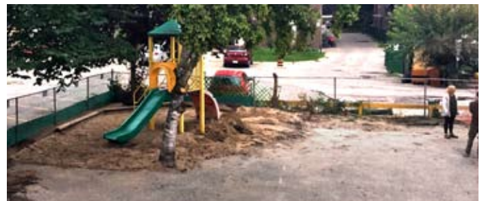
Der Spielplatz vor dem Umbau

Viele der alten Spielzeuge und das Klettergerüst wurden dankbar entgegengenommen von Pastor Gigi Young und einem Team der Toronto Chinese Lutheran Church in Scarborough. Auch weiterhin werden sie Kinder aus der Gemeinde und der Nachbarschaft viel Spaß bereiten.