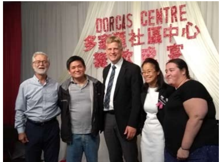
Vision Sharing Night für das Dorcas Community Centre welches der Rhenish Lutheran Church und Nachbargemeinde in Markham dient

Bitte melden sie sich im Kirchenbüro an oder besuchen sie unsere Website für mehr Informationen: LutheransToronto.org