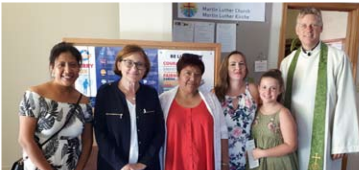
Die Daycare besucht die Gemeinde: Spendenaktion für den Terry Fox Lauf