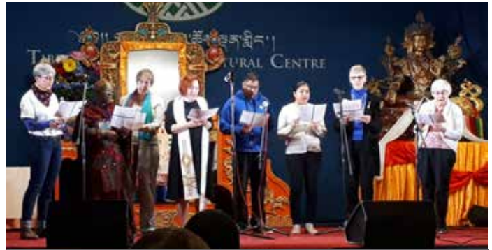
Lakeshore Interfaith Festival, 14. April, Tibetan Cultural Centre