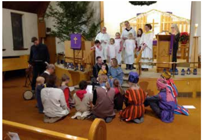
Gottesdienst mit der German International School

Bitte Spenden Sie haltbare Lebensmittel, Stofftaschen und/oder Hygieneartikel (z.B. Müsli, Fleisch- oder Fischkonserven, Pasta und Pastasaucen, Mac and Cheese, Konserven mit Suppe oder Gemüse, Erdnussbutter, Saftkartons, Cracker, Kaffee und Tee, Reis, Zucker, Toilettenpapier, Waschmittel, Seifenstücke, Shampoos in Reisgröße, Zahnbürsten und Zahnpasta) zur Unterstützung von WMUC Food Bank/Community Lunch.