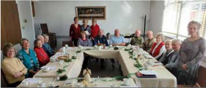
Adventssingen der Seniorengruppe

Bitte behalten sie die Jahreshauptversammlung am 23. Februar im Auge! In diesem Jahr wird das gemeinsame Bauprojekt der Martin Luther Kirche und Daycare nach dem Gottesdienst präsentiert. Wir entscheiden über die zukünftige Gestaltung unseres Gebäudes. Ihre Meinung ist uns wichtig! Bringen sie ihre Fragen mit und tragen so zum Erfolg des Projekts bei.