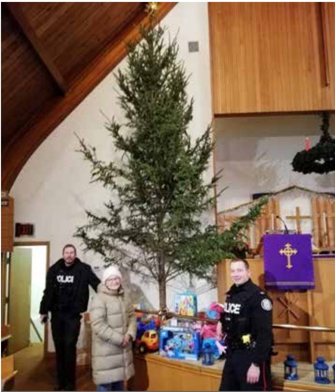
Die Torontoer Polizei lieferte Spielzeug von der Spielzeugsammlung zu Weihnachten für Kinder der Martin Luther Kindertagesstätte ab