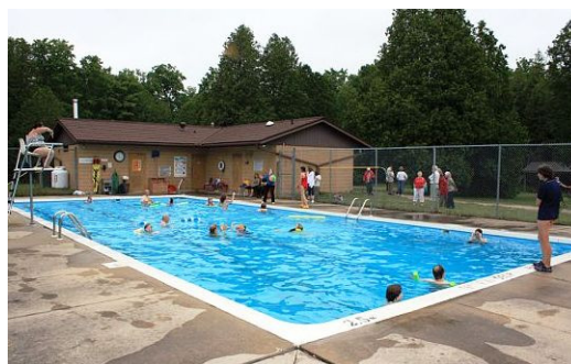
Trotz des kühlen Wetters erlebten wir einen bunten und fröhlichen Picknicktag in Camp Edgewood. Viele genossen den warmen Swimming Pool, der extra für uns geöffnet worden war.