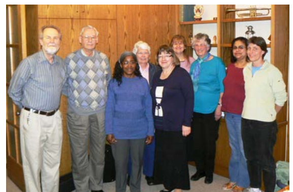
Unser Team "In Mission For Others" lud das Team " Faith and Hope " von der Wesley Mimico United Church zu einem sehr interessanten Austausch über hilfreiche Ansätze zum Gemeindeaufbau ein.