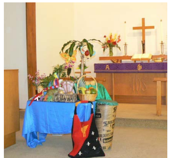
Am 1. März hatten die Kinder der Sunday School einen ganzen Tisch geschmückt mit vielfältigen, für Papua-Neuguinea typischen Gegenständen.