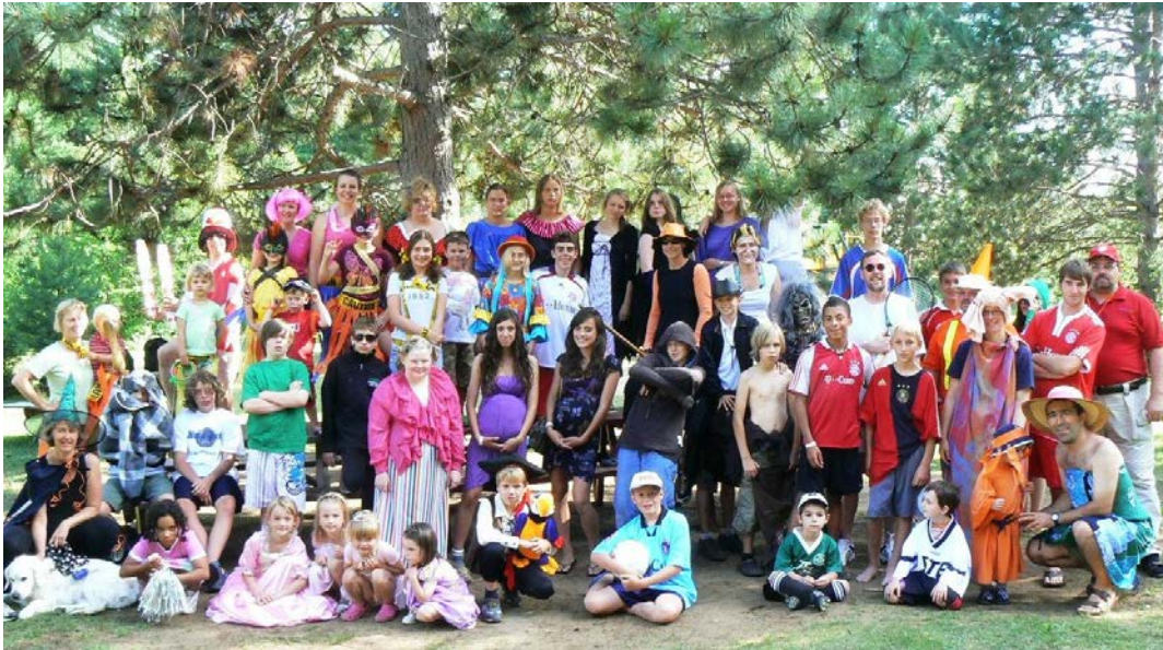
Eine große bunte fröhliche Gruppe kam beim Sommer-Camp zusammen.