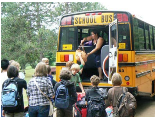
Trotz des nicht immer sonnigen Wetters hatten alle viel Spaß, bei Schwimmen und Kanufahren, bei White Water Rafting und Sportaktivitäten.