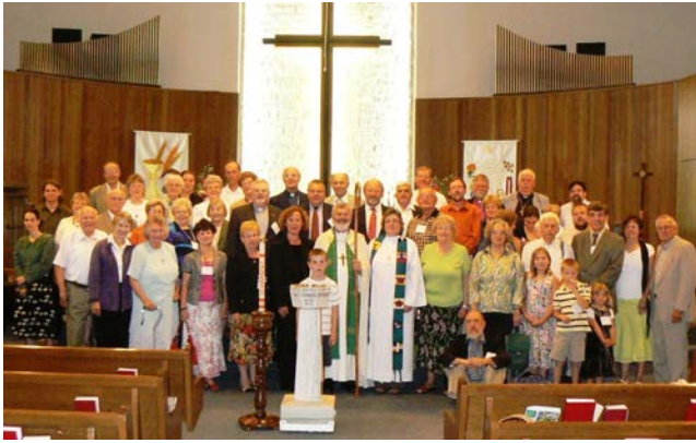
53 Teilnehmerinnen und Teilnehmer trafen sich bei der Vollversammlung der DELKINA (Deutschen Evangelisch-Lutherischen Kirchenkonferenz in Nordamerika) in Kelowna.