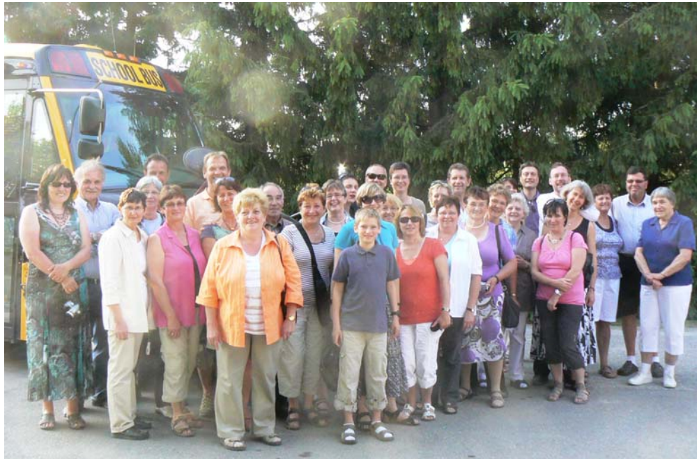
Konfirmationsfeier am Pfingstsonntag, 12. Juni 2011