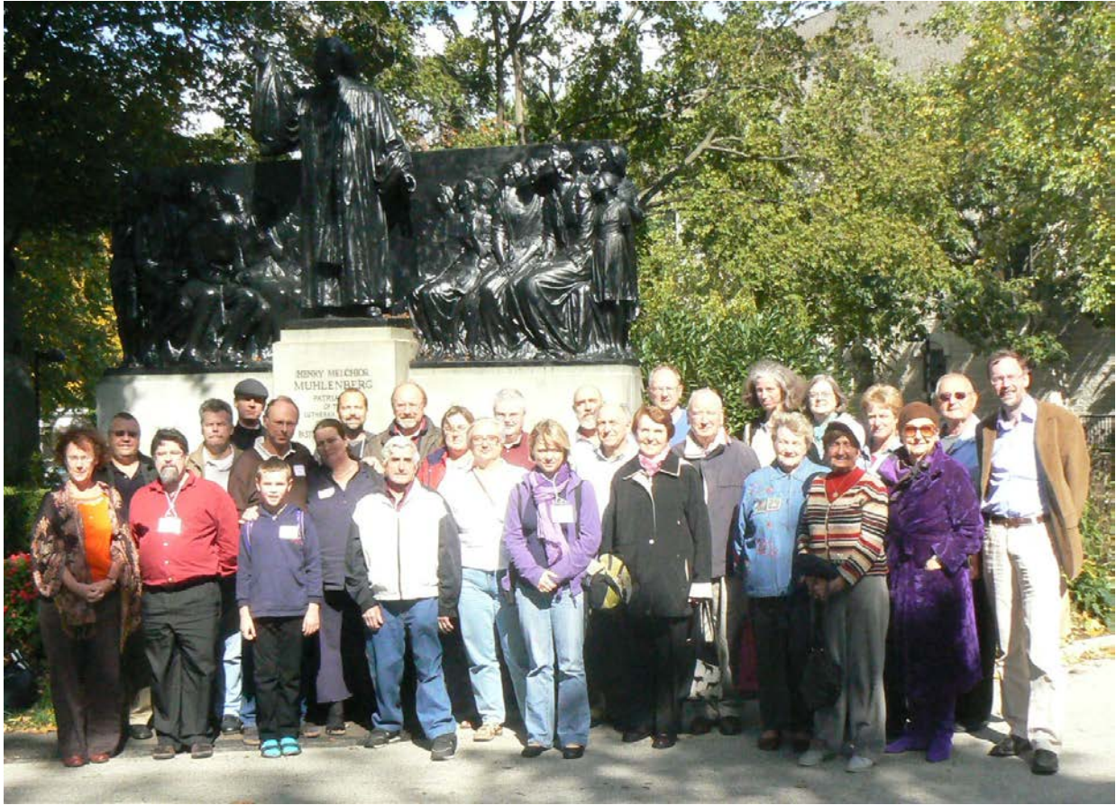
Gruppenbild von der DELKINA-Gruppe vor dem Mühlenberg-Denkmal des Lutheran Theological Seminary Philadelphia im Oktober 2011

Martin Luther Evangelical Lutheran Church 2379 Lake Shore Blvd. West, Toronto, ON M8V 1B7, Phone: 416-251-8293, Fax: 416-259-2889